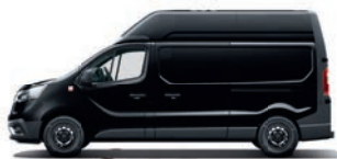
FURGONE A PANNELLI